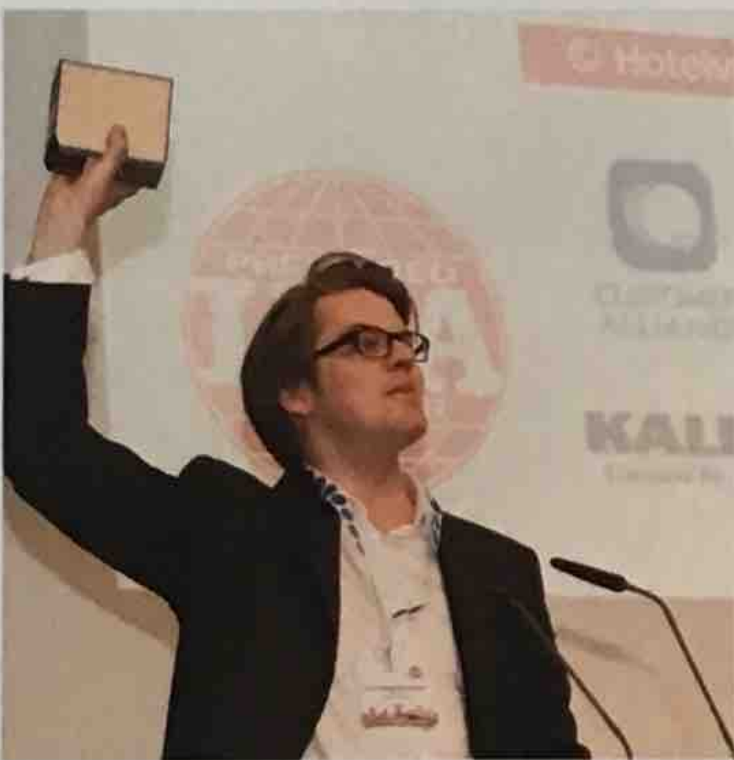
Der SuitePad Lobby-Projektor gewann den Titel „Produktinnovation des Jahres“.

Hinter Hotelshop.one steht das Stuttgarter Start-Up Interdependence GmbH.